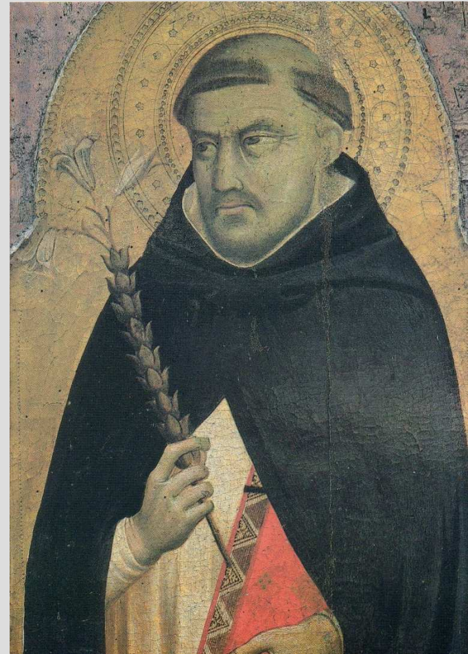
Bernardo Daddi, San Domenico , 1340 ca., Prato, Museo di Pittura Murale