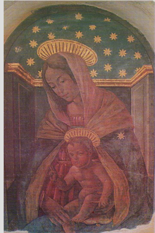
Tabernacolo del Carmine, Prato, via Mazzini, Madonna con Bambino