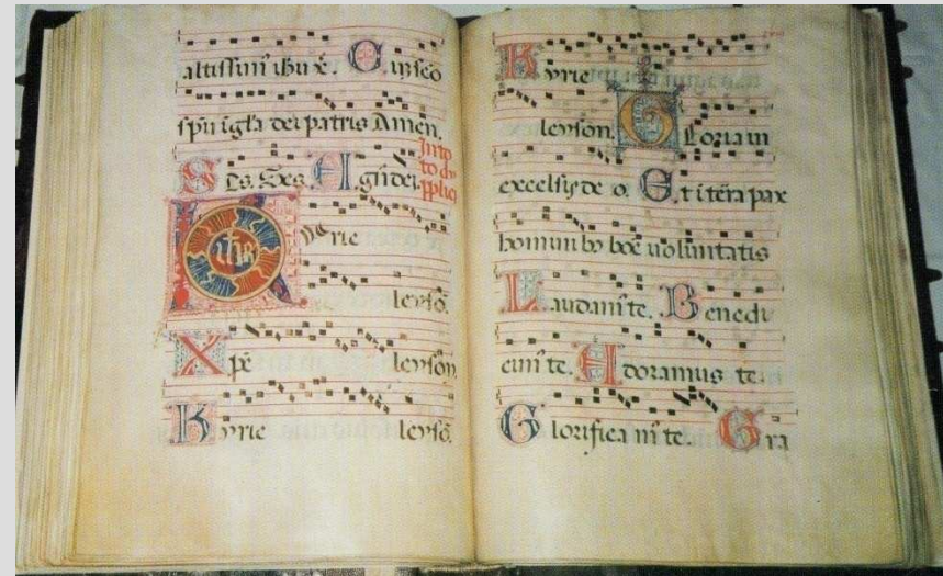
Corale Miniato, XVI sec., Prato, Conservatorio di San Niccolò