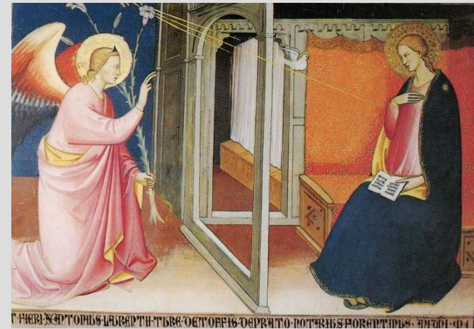
Lorenzo di Niccolò, Annunciazione, 1410. Prato, Museo dell'Opera del Duomo