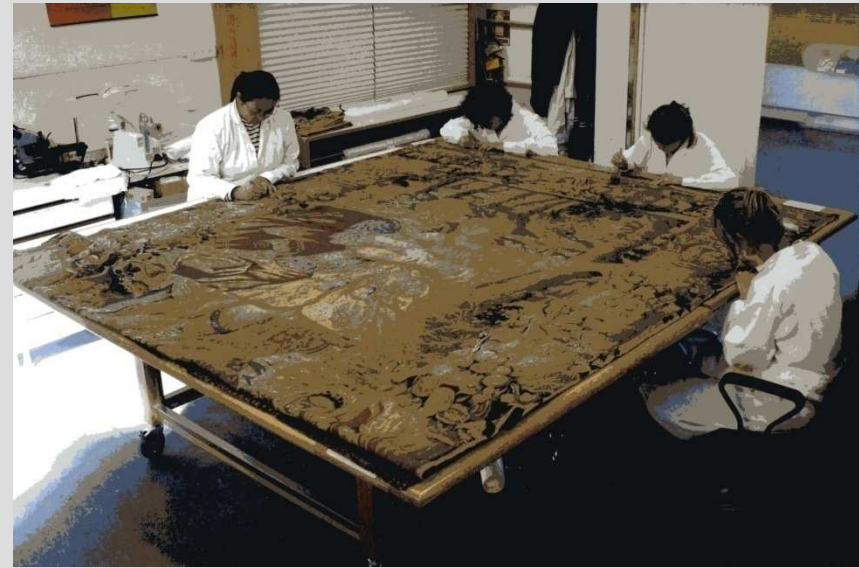
Laboratorio di Restauro “Giovanna Rucellai Piqué”, Prato, Museo del Tessuto