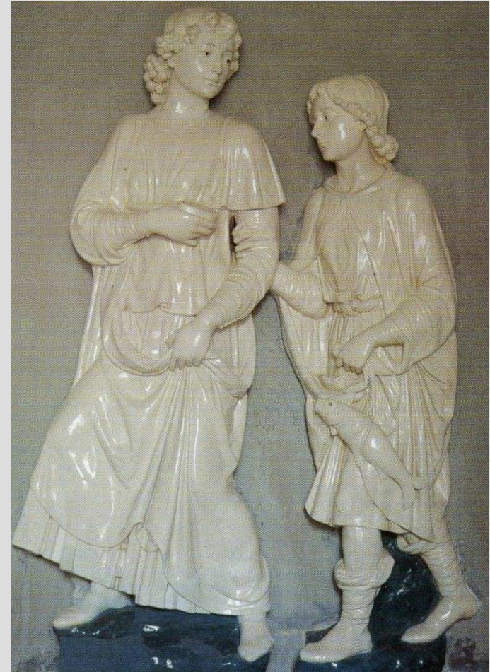
Andrea della Robbia, Tobiolo e l'Angelo , Prato, Biblioteca Roncioniana